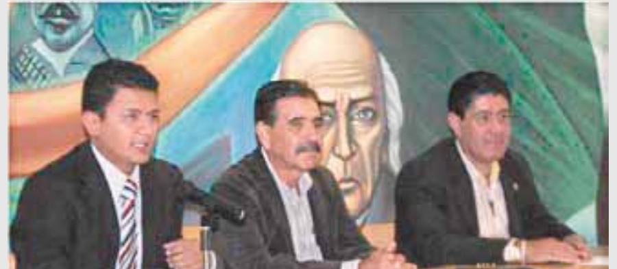
✂ Diputados participaron en una conferencia.

Con el escenario del Auditorio de la Unidad Académica de Derecho de la Universidad Autónoma de Nayarit, los representantes populares nayaritas se reunieron con el doctor Alfonso Nambo Caldera, quien dictó la conferencia “Legislación Civil y Penal de Nayarit”, ello en el marco del fortalecimiento de los mecanismos de vinculación entre el Poder Legislativo y la Máxima Casa de Estudios.