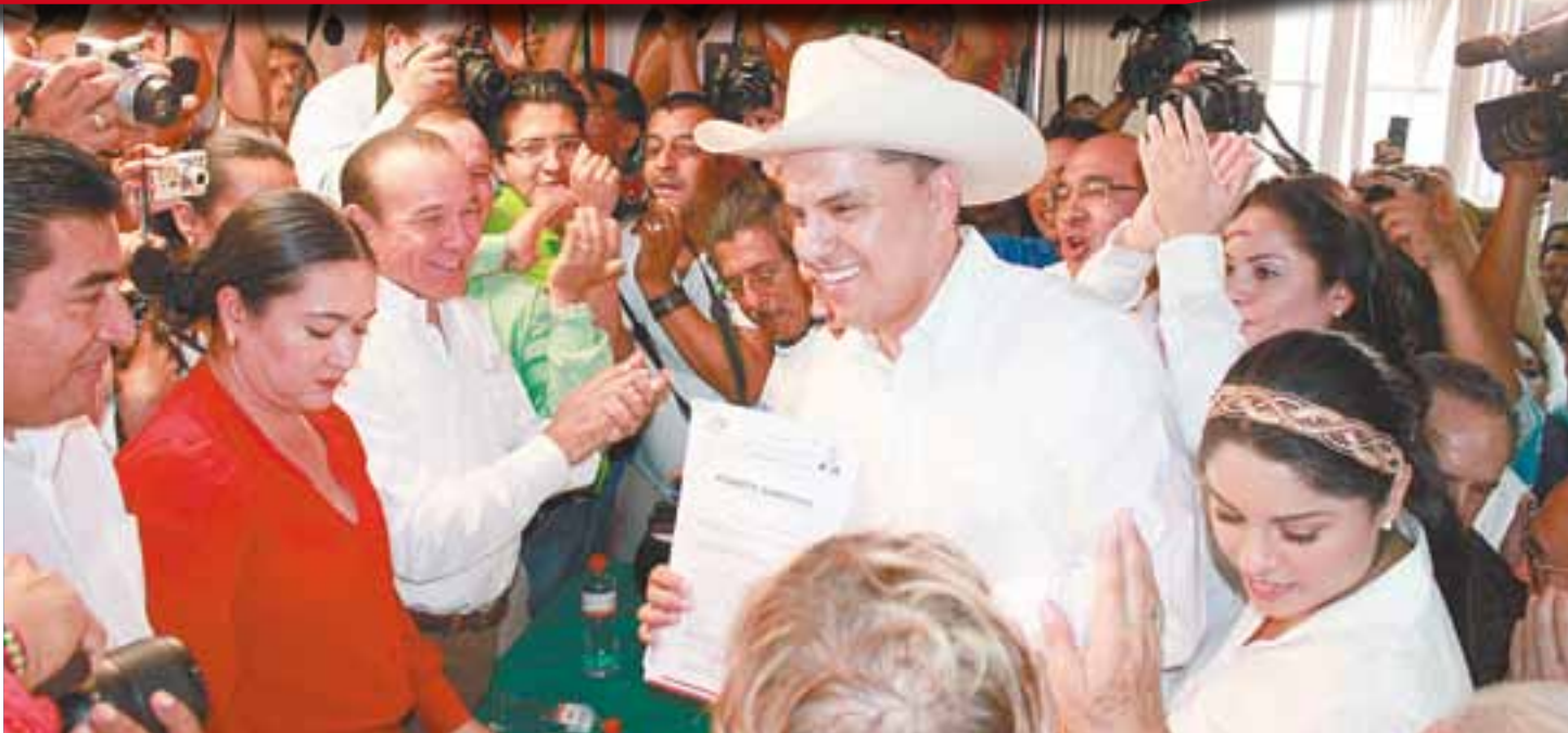
✂ Durante su registro como precandidato a la gubernatura de Nayarit.

PRI unido para construir la victoria de Nayarit".