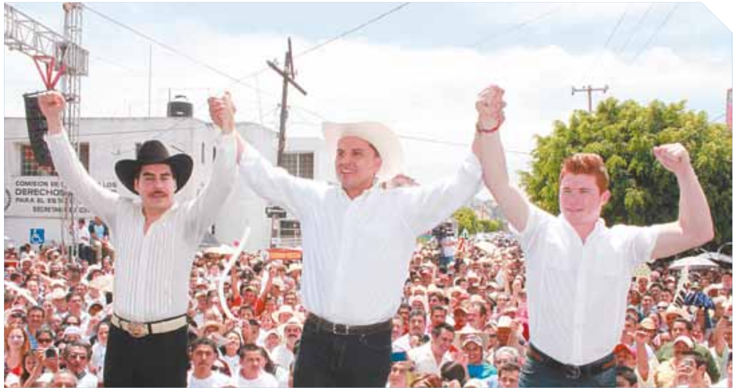
✂ Una fiesta popular organizó el precandidato con Ezequiel Peña y Saúl "Canelo" Álvarez.

R OBERTO SANDOVAL SE REGISTRÓ como precandidato de la alianza PRI-PVEM-PANAL a la gubernatura de Nayarit en medio de una fiesta popular y acompañado del campeón mundial de peso Súper Walter Saúl "Canelo" Álvarez, Luis Donald Colosio Jr.; Ezequiel Peña, del líder nacional del PANAL Jorge Kahwagi.