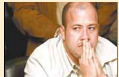
✘ Enrique Alfaro.

La penitencia, donación de dos días de salario presidencial a una causa noble, es una autopropuesta de enmienda ante la sociedad; lo que viene a ampliar el código moral no hablado de la política jalisciense, acercando a los representantes públicos a la absolución espiritual como salida extra