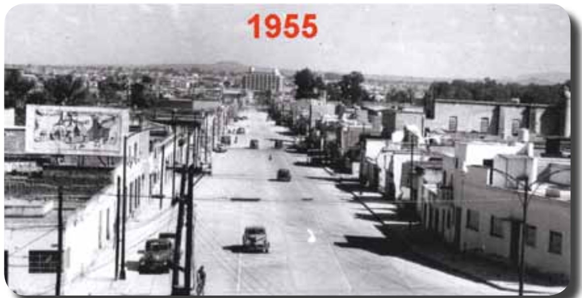
✘ Avenida Niños Héroes, en 1955.

Doce días después de iniciados los trabajos, el 6 de abril, en cuatro de las principales avenidas, dentro de un plan