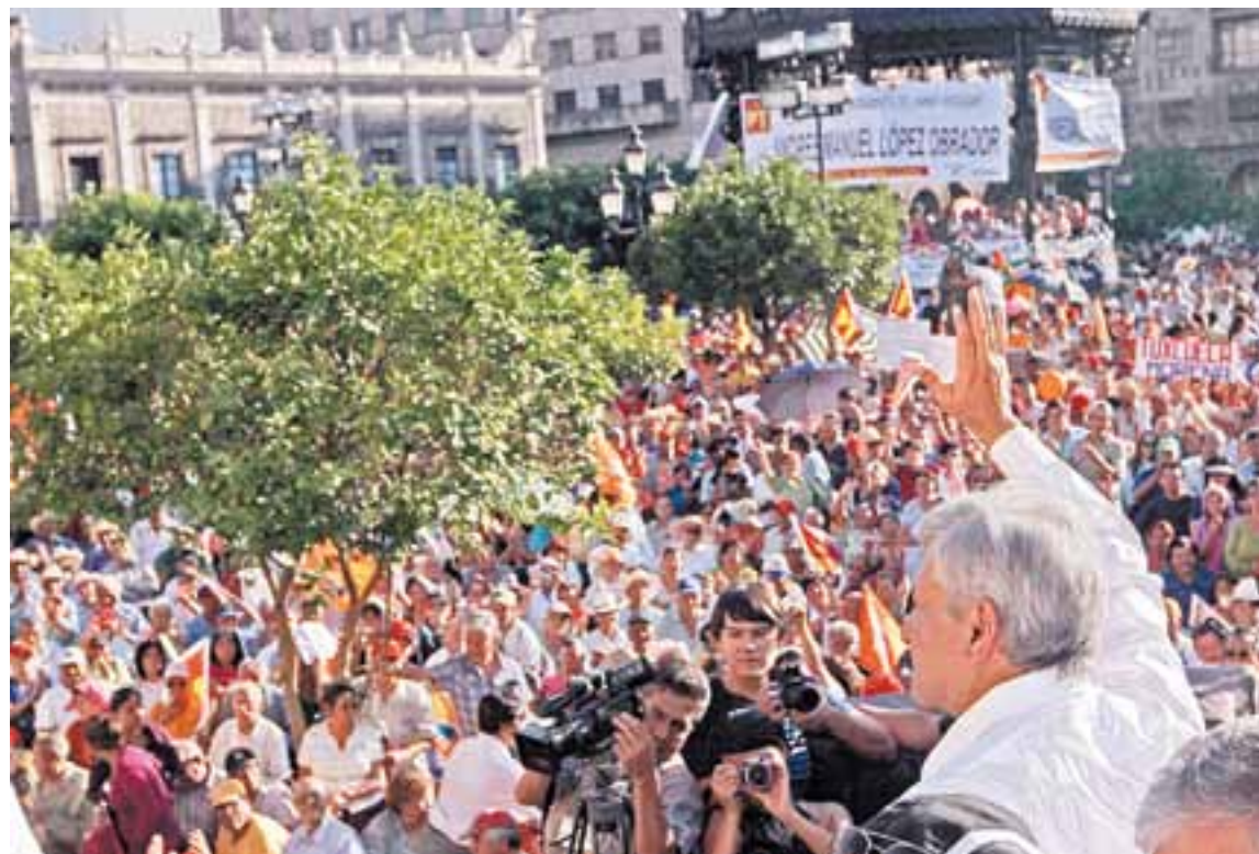
El viernes Andrés Manuel López Obrador realizó un mitin en Plaza de Armas de Guadalajara, en gira con su movimiento Regeneración Nacional.

Nada de sospechosismo, simple táctica preelectoral, hacerse el necesitado, aparecer como el que llegará al final de la batalla para recoger cuerpos