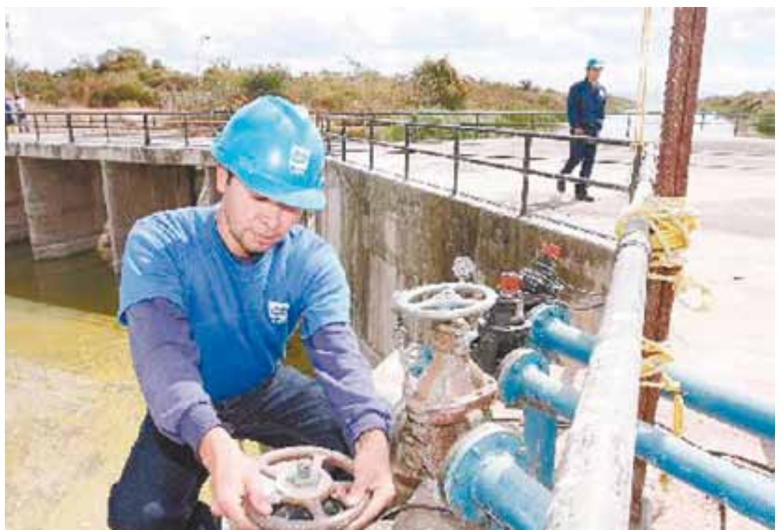
✘ El SIAPA, en estado terminal, vive los últimos días de su actual estructura.