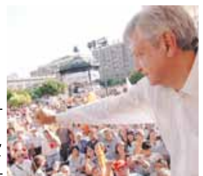
Andrés Manuel visitó Guadalajara.

"Reiteró que su movimiento busca una transformación nacional equivalente a la Independencia, la reforma del presidente Benito Juárez y la Revolución Mexicana, por eso busca crear más de 65 mil comités seccionales con sus simpatizantes.