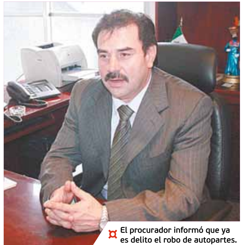
El procurador informó que ya es delito el robo de autopartes.

Aseguró que se obtiene más delinquiendo en otro tipo de establecimientos, por lo pronto la procuraduría está planeando estrategias para hacer que los atracos disminuyan.