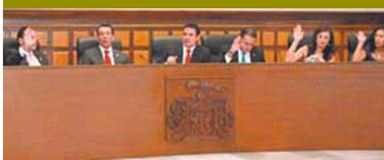
Sesión del Ayuntamiento de Guadalajara.

LOS REGIDORES DEL GOBIERNO Municipal de Guadalajara acordaron regresar a comisiones el dictamen que reforma el Reglamento para el Funcionamiento de Giros Comerciales, Industriales y de Prestación de Servicios, referente a la seguridad de los bancos.