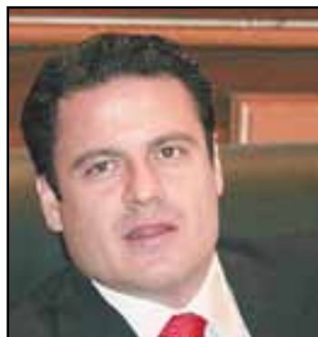
ARISTÓTELES SANDOVAL Pide reorientación del SIAPA

Garantiza el secretario General de Gobierno, que el Estado aplicará la ley ante cualquier irregularidad que se hubiera cometido al interior del SIAPA durante la anterior administración, pero exige también que se presenten las pruebas y denuncias de presuntos desvíos. Existe la petición de una prórroga hasta diciembre cuando se termine de justificar en qué se utilizó el dinero.