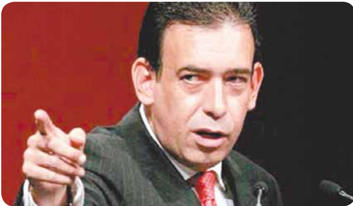
✂ Humberto Moreira inicia con el pie derecho el arranque de las campañas.