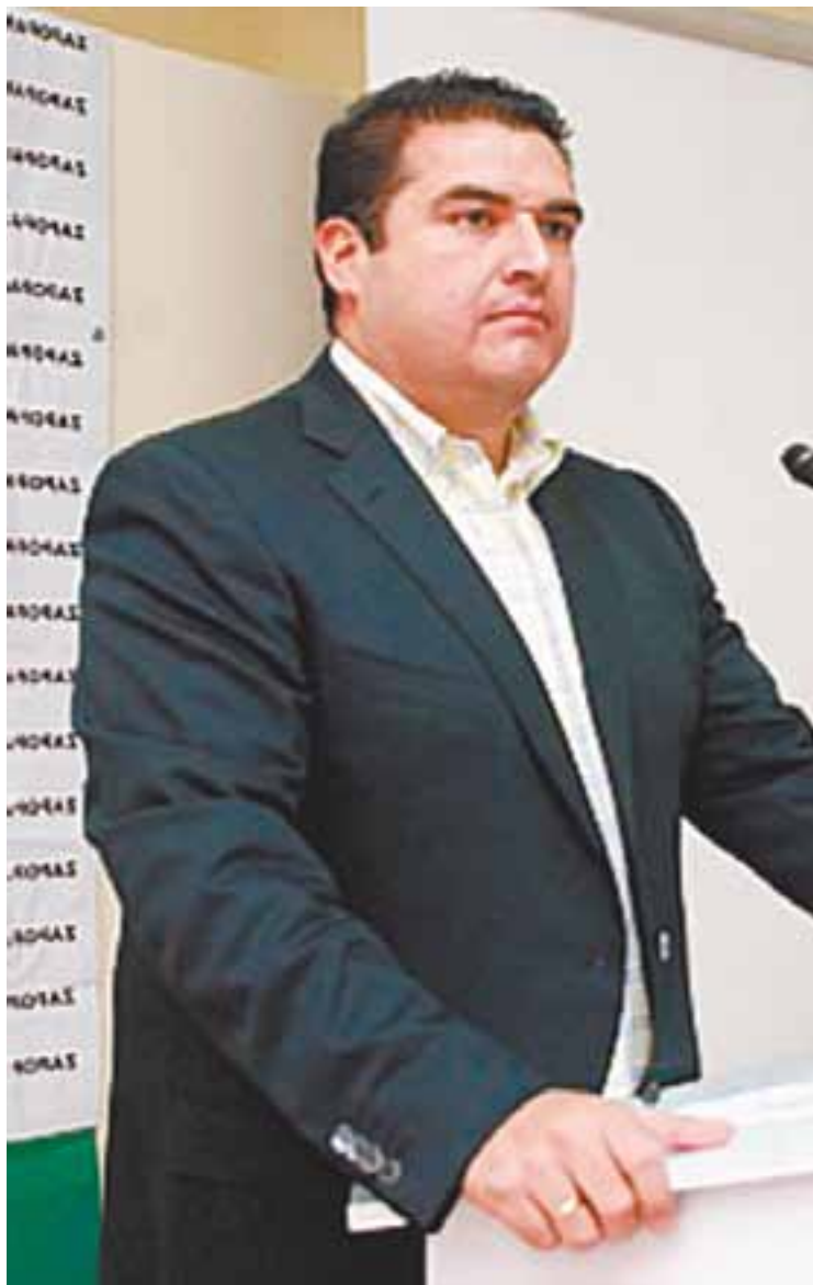
✘ Héctor Vielma, alcalde de Zapopan y presidente del Consejo de Administración, congruente en su discurso contra la corrupción destapó la cloaca del SIAPA.

Quienes conocen de cerca de Héctor Vielma saben de su mecha corta y absoluta intolerancia contra cualquier indicio de corrupción y malos manejos. En su administración ha cortado cabezas ante la más mínima sospecha y, en el caso del SIAPA, no podía ser de otra manera