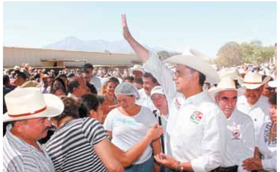
Durante su gira de campaña mucha gente va a sus eventos.