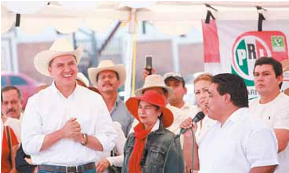
El candidato por Nayarit nos Une estuvo con los maestros en su día.