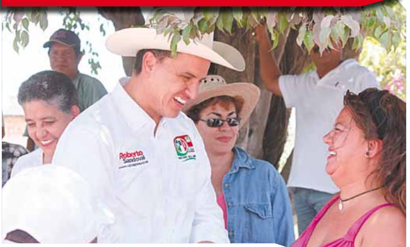
Roberto Sandoval, el candidato del pueblo a través del dialogo abierto compartió propuestas en beneficio del gremio magisterial, de igual forma escuchó las inquietudes por parte del sector, quienes le manifestaron su apoyo en el proyecto que encabeza rumbo a la victoria de Nayarit.