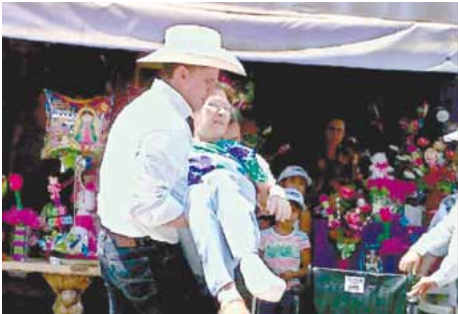
Durante sus recorridos sorprende a la gente por su espontaneidad.