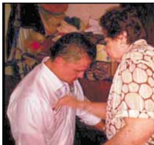
El candidato recibe la bendición de su madre.