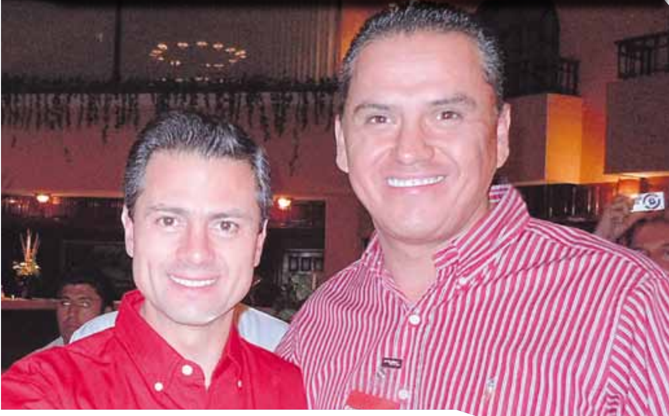
Enrique Peña Nieto vendrá el próximo 4 de junio a reunirse con Roberto Sandoval, para fortalecer los objetivos de campaña.