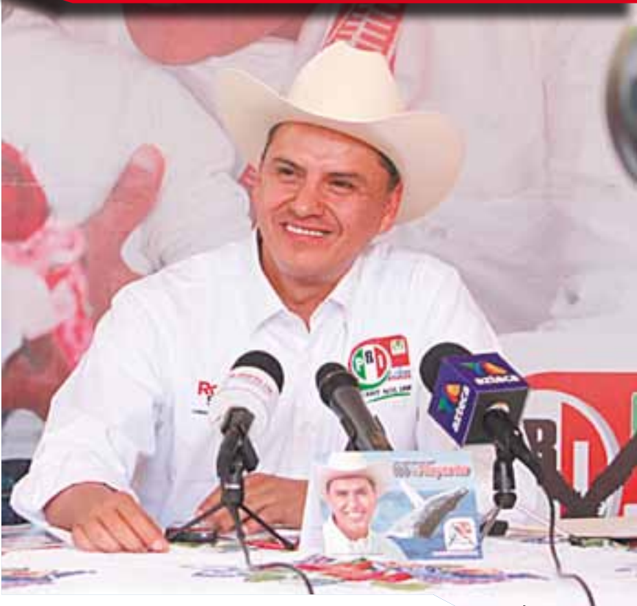
A unas semanas de comenzar la campaña de la victoria, continúan los beneficios que otorga Roberto Sandoval, para los jefes de la tercera edad, discapacitados, madres solteras y jóvenes, al repartirse más de 10 mil tarjetas en todo el estado.