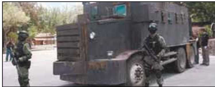
► Los tanques de la delincuencia organizada. Este trailer blindado fue decomisado en Camargo, Tamaulipas.

Los esfuerzos en la lucha contra el crimen realizados por el gobierno mexicano han mostrado que sus capacidades militares y policiales siguen siendo inadecuadas para quebrantar al crimen organizado y contener la violencia criminal, dejando la llamada guerra en un polvorín