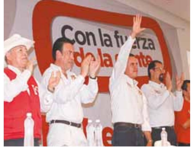
Humberto Moreira estuvo en Tepic para fortalecer la estructura priista.

En su visita a Tepic el presidente del CEN del PRI, Humberto Moreira Valdés convocó a candidatos y estructura de promoción del voto en Nayarit a no bajar la guardia en la entidad ante los "bribones del PAN", que buscarán comprar representantes electorales, robar urnas e imponer la mentira para ganar espacios en la elección a gobernador del próximo 3 de julio. Sin embargo, a quien el pueblo quiere de Gobernador, es a Roberto Sandoval, quien fue impuesto por la gente y no por grupos o corrientes políticas.