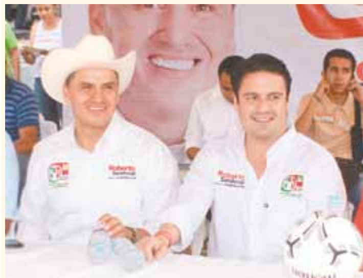
▶ Roberto Sandoval recibió al alcalde de Guadalajara, Aristóteles Sandoval.

Esta gira de trabajo culminó, con la presentación de una función de lucha libre de la AAA, en el municipio de Santiago Ixcuintla, donde Roberto Sandoval departió con los santiaguenses el aporte de entretenimiento, recreación y sano esparcimiento.