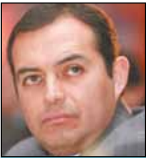
ERNESTO CORDERO Visita Nayarit

En breve visita de apoyo electoral el secretario de Hacienda, Ernesto Cordero, exhortó a los nayaritas a votar por los candidatos panistas, para que Nayarit vuelva a tener seguridad, paz y bienestar económico que hace mucho perdió.