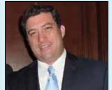
ALFONSO PÉREZ OCHOA

el senador del PRD, Jprecisó que se deben vigilar las finanzas públicas de Nayarit, pues apenas el pasado 19 de mayo su Congreso aprobó al gobierno estatal un nuevo endeudamiento por 300 millones de pesos. "No es justo ni ético que al final del sexenio, el gobierno actual de Nayarit eleve día con día la deuda estatal y que le transfiera a los futuros gobiernos su pago, porque al final seremos los nayaritas quienes la pagaremos", añadió.