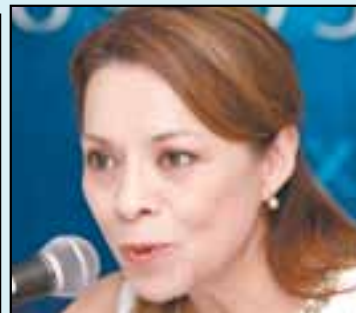
JOSEFINA VÁZQUEZ MOTA

Reprobó la actitud del presidente Felipe Calderón, al considerar que Nayarit no debe convertirse en una circunstancia que dependa de la fuerza policial para ganar una elección.