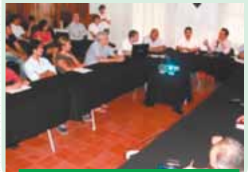
El alcalde atendió a locatarios.

El presidente municipal, Salvador González Resendiz, confirmó que será el 15 de julio cuando sea retirada la malla que protege las obras de rehabilitación del malecón, dado que los trabajos avanzan a buen ritmo y acorde al calendario. Esto durante la reunión con locatarios, comerciantes y restauranteros de la zona, a quienes se presentó un balance de las acciones realizadas en la última semana tanto en el tema de obra pública como el de promoción, además de atender las diferentes inquietudes y necesidades de este sector comercial, con el cual se ha mantenido una importante comunicación desde el inicio de este proyecto.