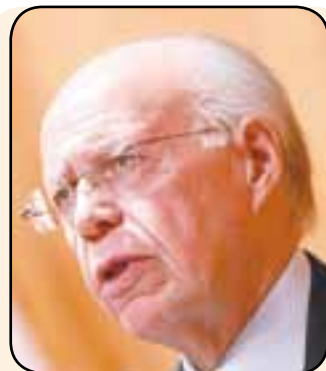
JOSÉ NARRO ROBLES

La ex presidenta del PRI, Beatriz Paredes, "metió las manos al fuego" por Eruviel Ávila, candidato priista a gobernador del estado de México, en una reunión con empresarios, ante quienes sostuvo que se la juega para que gane la gubernatura mexicana y que cumpla sus ofrecimientos en su administración. Afirmó que Eruviel puede ganar la prueba de la comparación de los electores frente a los otros candidatos.