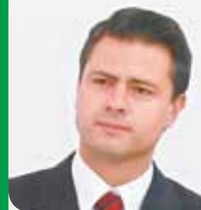
ENRIQUE PEÑA NIETO

El rector de la UNAM aseguró que no puede haber democracia verdadera donde no impere la seguridad y las instancias de impartición de justicia no cuenten con integridad y credibilidad necesarias. Dijo que la democracia moderna requiere de la confianza de los ciudadanos en las instituciones que se han creado para que la vida en común transcurre con estabilidad.