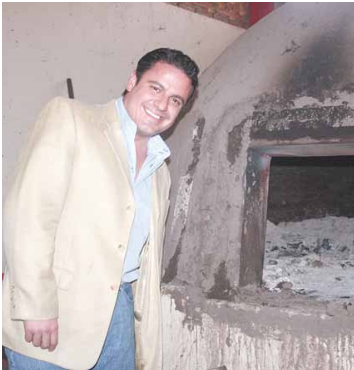
✘ Aristóteles Sandoval hornea el escenario político del 2012.

A un año y medio de gestión al frente del municipio de Guadalajara, después de asumir el cargo de alcalde el primero de enero del 2010, Aristóteles sigue en el liderato para gobernar Jalisco como el aspirante natural y más lógico del PRI después de ganar las elecciones del 5 de julio del 2009 de la capital del Estado, legitimado en una elección constitucional que le ganó al candidato de Acción Nacional Jorge Salinas Osornio por 16.3 puntos porcentuales, en donde el PRI obtuvo 48.39 puntos contra 32.9 del PAN.