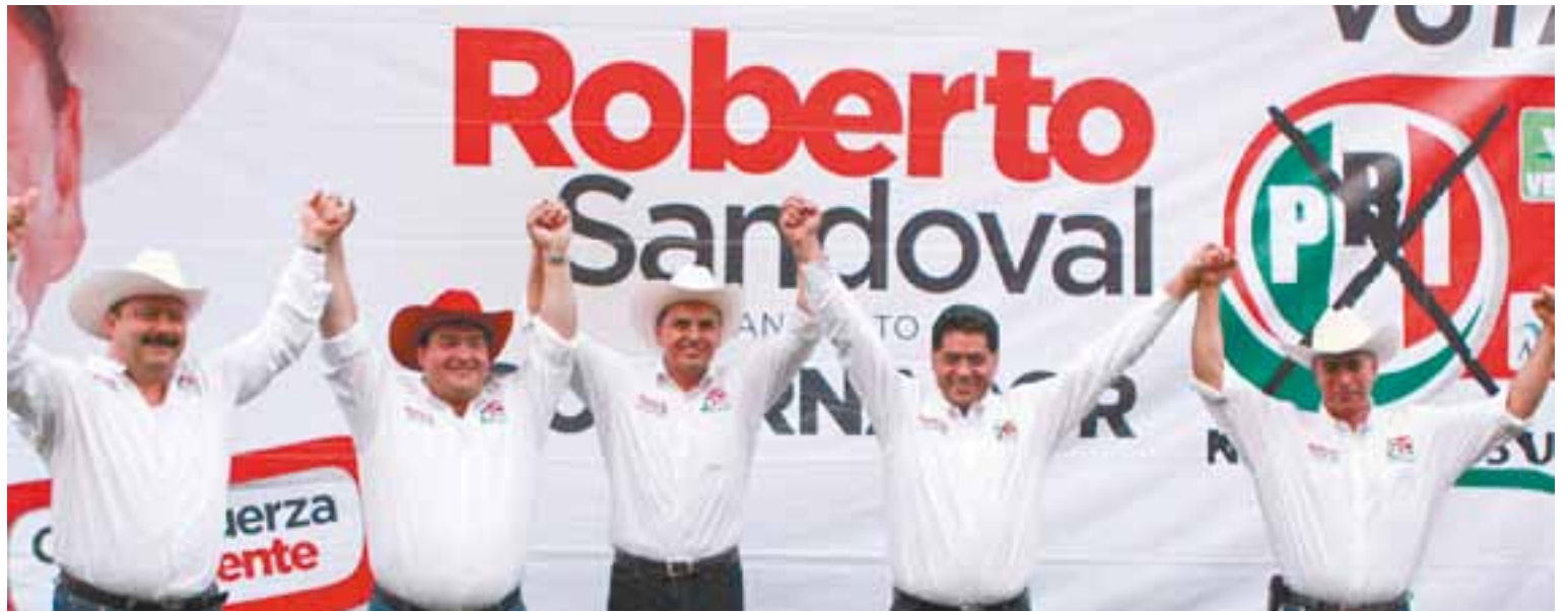
Los mandatarios Mario Anguiano Moreno, de Colima; Javier Duarte Ochoa, de Veracruz; Jorge Herrera, de Durango y César Duarte, de Chihuahua, reconocieron que Roberto Sandoval es la mejor propuesta.

Además recibió el apoyo del Sindicato del IMSS, de comerciantes de Tepic y productores,