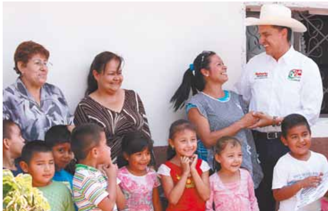
▶ Roberto Sandoval con las familias nayaritas.

La campaña por la gubernatura de Nayarit de Roberto Sandoval fue sólida desde el inicio y pegó en el contacto y apertura con la gente y finaliza en esta última semana de junio con todo el apoyo para ganar la elección del 3 de julio, de acuerdo a las mediciones y respuesta de los nayaritas a su propuesta incluyente del Gobierno de la Gente.