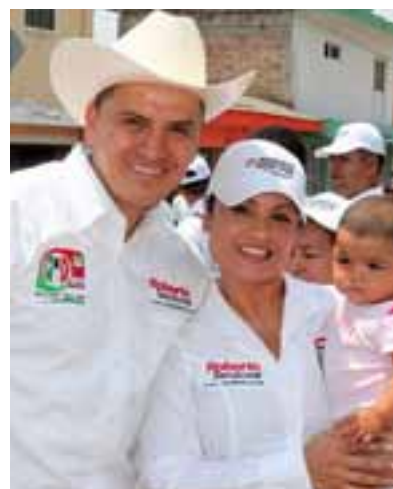
▶ Garantías para la niñez.