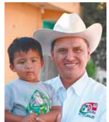
▶ Salud y educación para la niñez.