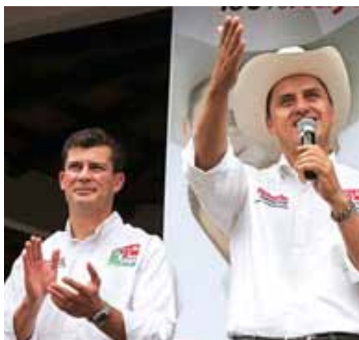
▶ Impulso al deporte.

Y a los campesinos, les dijo que la prioridad es impulsar el desarrollo del campo para recuperar la fuerza y el orgullo de Nayarit.