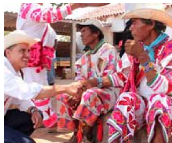
▶ En la región serrana.