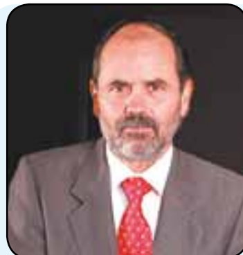
GUSTAVO MADERO No se adelantarán los tiempos

La cúpula del PRI está en los preparativos de las elecciones federales de 2012. Al tiempo que el partido lanzó el portal "Yo sí gano", el dirigente nacional de este partido, se reunió con líderes priístas para anunciar la renovación del Consejo Político Nacional. En el cónclave, los priístas también conocieron un programa de austeridad para lograr ahorros rumbo a los comicios así como la elección de diputados y alcaldes.