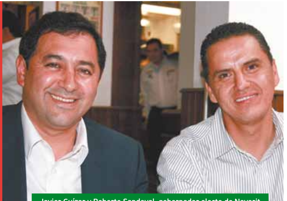
Javier Guízar y Roberto Sandoval, gobernador electo de Nayarit.

“ Yo creo que siempre hay que cambiar para mejorar. Por eso creo que México y Jalisco van a cambiar de partido político en sus diferentes niveles de gobierno, como lo es el gobierno del Estado y la presidencia de la República, para mejorar. ”