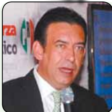
HUMBERTO MOREIRA Lanzan portal "Yo sí gano"

La cúpula del PRI está en los preparativos de las elecciones federales de 2012. Al tiempo que el partido lanzó el portal "Yo sí gano", el dirigente nacional de este partido, se reunió con líderes priístas para anunciar la renovación del Consejo Político Nacional. En el cónclave, los priístas también conocieron un programa de austeridad para lograr ahorros rumbo a los comicios así como la elección de diputados y alcaldes.