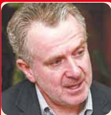
SANTIAGO CREEL MIRANDA

Luego de lanzarse por su cuenta al ruedo para la candidatura de su partido, el PAN, el senador Santiago Creel comenzó sus rebotes políticos. En el partido le dijeron que no es tiempo de lanzar cuetes, que primero la plataforma y luego el personaje. Les pidió a los otros precandidatos que soliciten permiso en sus chambas y ni le hicieron caso, y el PAN dice que no obligarán a nadie a dejar cargos. Sale solo, baja solo.