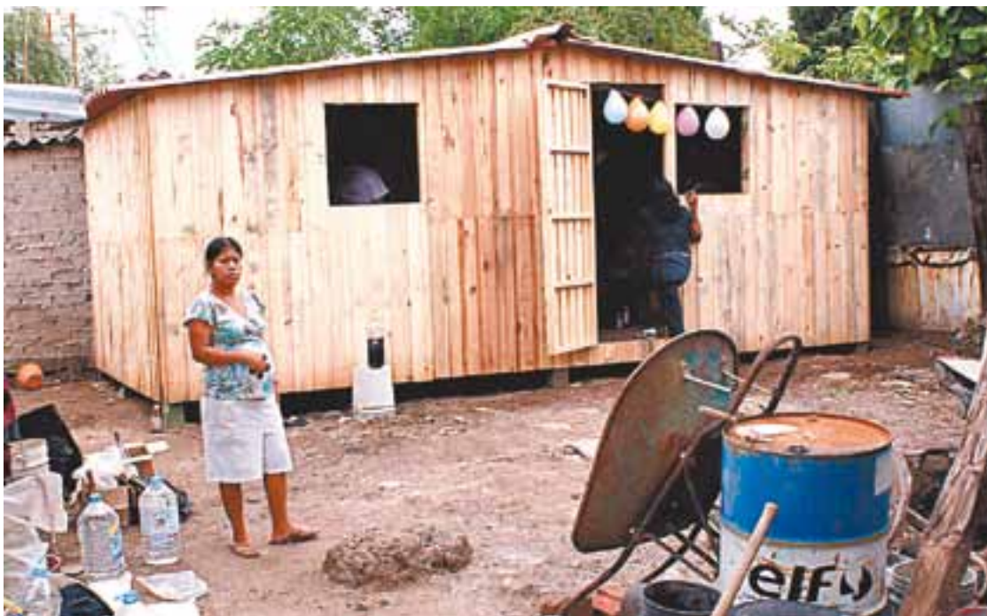
Una de las diez casas entregadas en Las Casetas, en la colonia Ferrocarril.

En Guadalajara viven más de 178 mil adultos mayores que demandan servicios, asistencia social, trabajo, independencia, participación y recreación. La secretaria de Desarrollo Social trabaja en tres ejes: