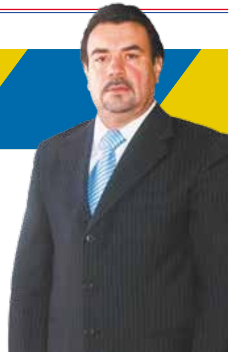
Procurador Tomás Coronado.

Como lo anterior podemos también reconocer que la Procuraduría de Justicia del Estado, a través de su Instituto de Formación Profesional, con su programa de capacitación especializada, profesionaliza a servidores públicos de su área; tal es el caso de la recientemente realizada Maestría en Políticas Públicas de Gobiernos Locales que fue concluida por 18 funcionarios del gobierno de Jalisco, de los cuales dos pertenecen al Consejo Estatal de Seguridad Pública de Jalisco y los 16 restantes a la Procuraduría de Justicia del Estado, incluido el procurador Tomás Coronado Olmos.