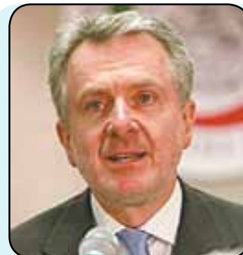
SANTIAGO CREEL Va oficialmente por la candidatura

Determinará la estrategia para posicionar los liderazgos, pero sin que ello represente modificar los tiempos.