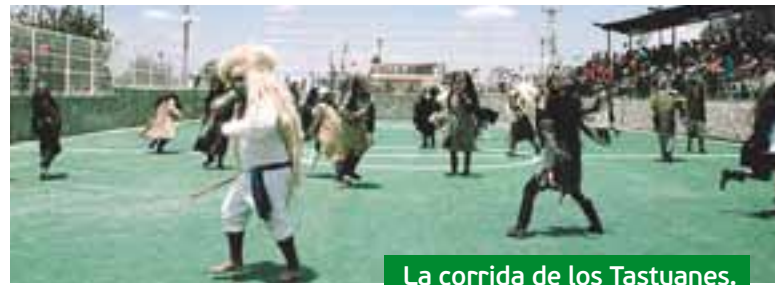
La corrida de los Tastoanes.