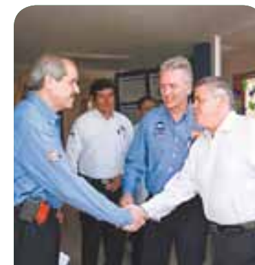
Un acuerdo para mejorar la salud mental tonalteca.

Cabe señalar que el CISAME en Tonalá dará también atención a la población de Ixtlahuacán del Río, Cuquíó, El Salto, Zapotlanejo y Juanacatlán.