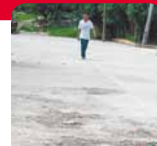
Se amplía el desarrollo urbano en Tonalá.

Posteriormente fue inaugurada una obra situada en la Privada Allen de en la cabecera municipal.