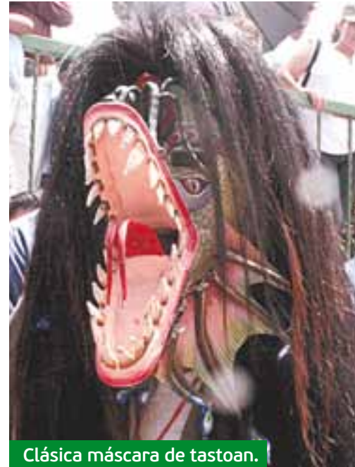
Clásica máscara de tastoan.