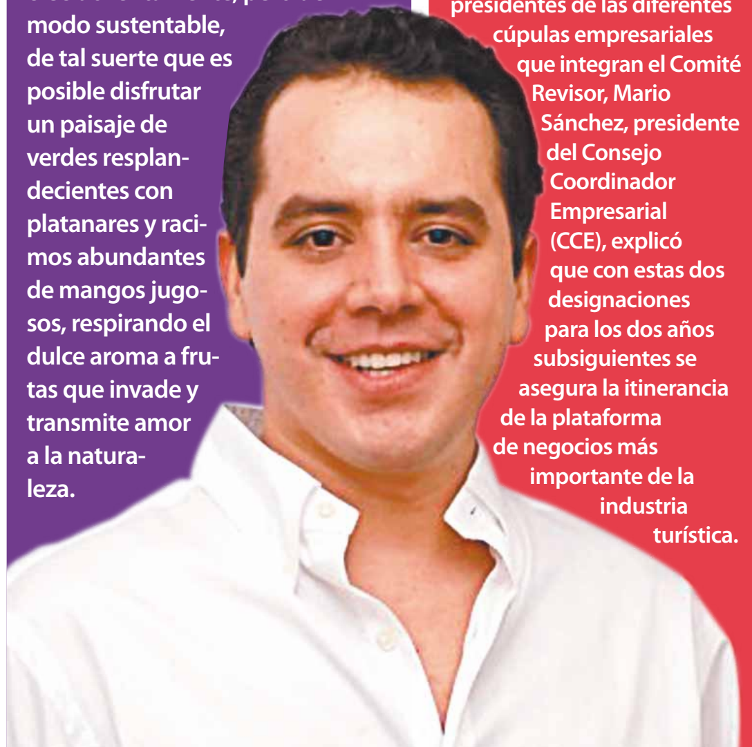
Salvador González Reséndiz, alcalde de Puerto Vallarta.