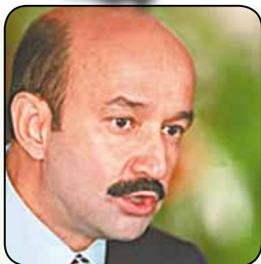
CARLOS SALINAS DE GORTARI