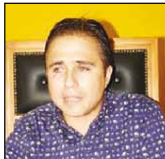
JOSÉ DE JESÚS PÉREZ

La diputada federal trabaja para que al estado pueda llegar el recurso que permita realizar obras, emprender programas y acciones a favor de los nayaritas, para quien trabaja en el Congreso Federal y a quienes les rendirá cuentas, con gestiones para su beneficio. "No voy a apoyar el bolsillo de un gobernante para que se lleve el presupuesto, sino voy a trabajar por los nayaritas".