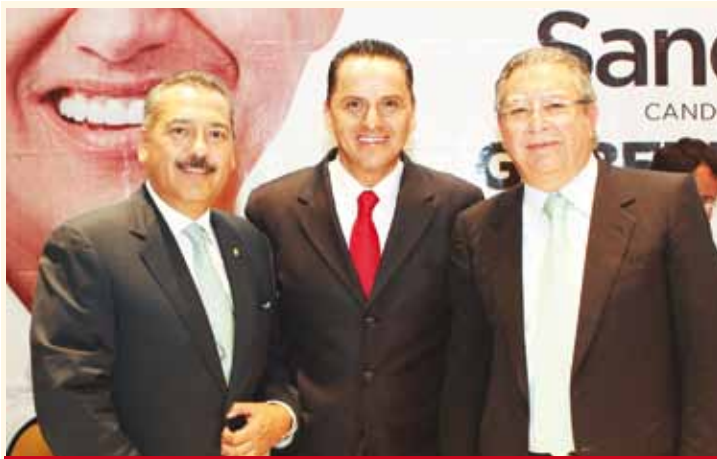
Manlio Fabio Beltrones, Roberto Sandoval y Francisco Rojas

"Debemos tener confianza y denunciar a los delincuentes para que el gobierno caiga con todo el peso de la ley, por que somos más los buenos que los malos y queremos vivir tranquilos, todos podemos aportar llamando al 089, es anónimo y confidencial, estamos para escucharte, comprometernos y cumplir", señaló el mandatario estatal.