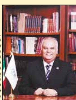
RECTOR DE LA UAN